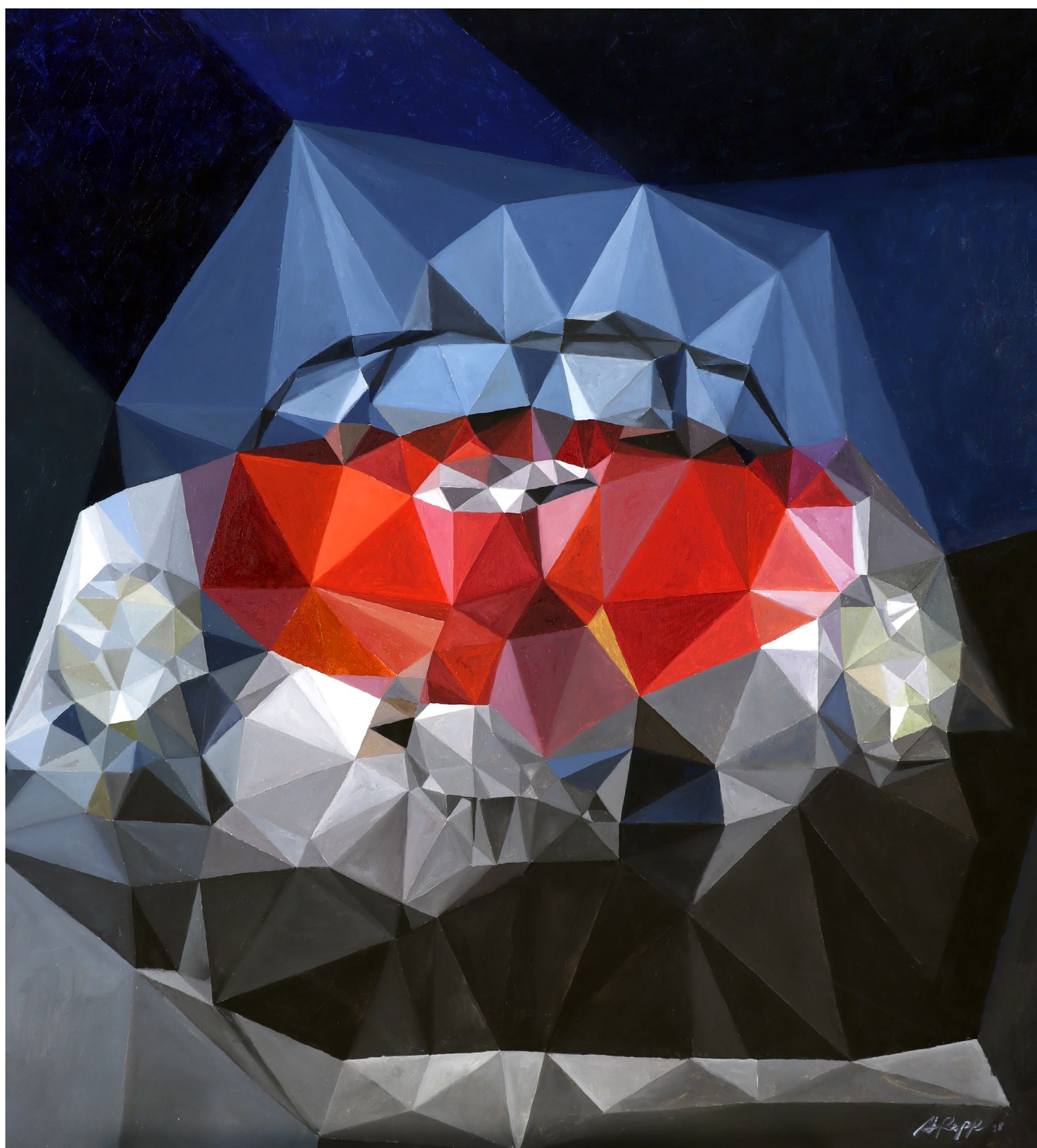
Alberto Peppoloni, Porsche 356 Speedster "Giant Killer" Decomposta 2018 - oil on canvas 83x83cm